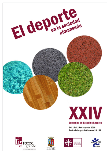
- Figura 1 - Cartel de las XXIV Jornadas

El lunes 14 de mayo se celebró una mesa redonda a modo de prólogo de las Jornadas, algo que viene haciendo cada año el Área de deportes del Ayuntamiento