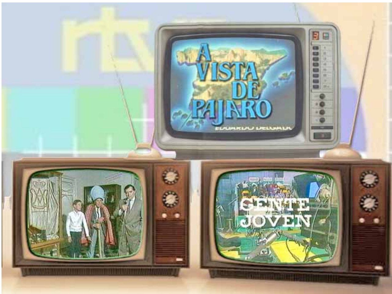
Fig. 9: Programas de TVE como “A Vista de Pájaro”, “El día del Señor” o “Gente Joven” mostraron Almansa y a los almanseños durante la década de los 80.

la entonces pareja de moda. Rodaron en distintas localizaciones, como la estación y el mercado, y venían acompañados del cantante Francisco, ya que el destino final del tren era Valencia, su tierra natal, a la que llegarían haciendo varias paradas, una de ellas en Almansa. (Fig. 9)