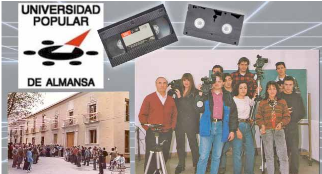
Fig. 11: Curso de video impartido en la Casa de Cultura en 1993.

La Universidad Popular, desde la inauguración de la Casa de Cultura en 1983, siempre prestó especial atención a las artes y a las nuevas tecnologías como la fotografía o el video, impartiendo cursos de todas ellas. Los primeros cursos de video contaban con escasos medios y se comenzaron a impartir a finales de los 80.