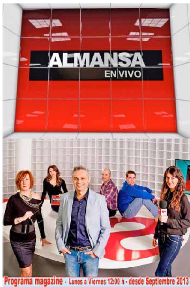
Fig. 28: El matinal diario “Almansa en Vivo” comenzó a emitirse en septiembre de 2013 y cuanta la actualidad local realizando conexiones en directo desde varios puntos de la ciudad.

En estos años, se cambió la denominación de la empresa a Alma Telecom con la intención de poder ofrecer servicios globales. En 2009 toda la red de cable sería ya de fibra óptica, y los servicios aumentarían, ofreciendo también telefonía fija, telefonía móvil o electricidad a los hogares. En 2010 recibe el galardón de Expot/film en Madrid como mejor empresa local de TV por cable. Es socio principal de la plataforma Open cable y durante algunos años preside AOTEC, la asociación de operadoras locales de telecomunicaciones. En 2014 se produce el canal de moda y tendencias Almantis TV, que tan solo funcionaría unos meses. (Fig. 30)