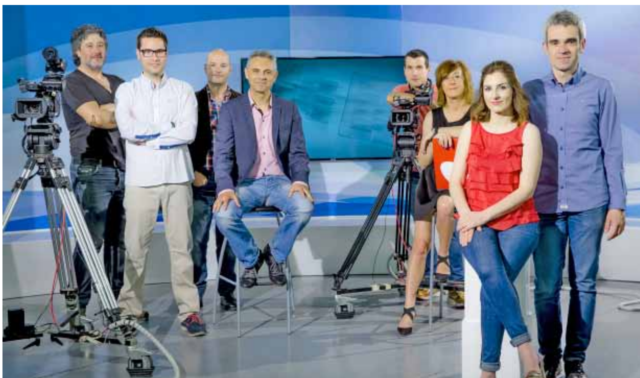
Fig. 30: Equipo de cámaras y presentadores de TV Almansa en las elecciones municipales de 2015.