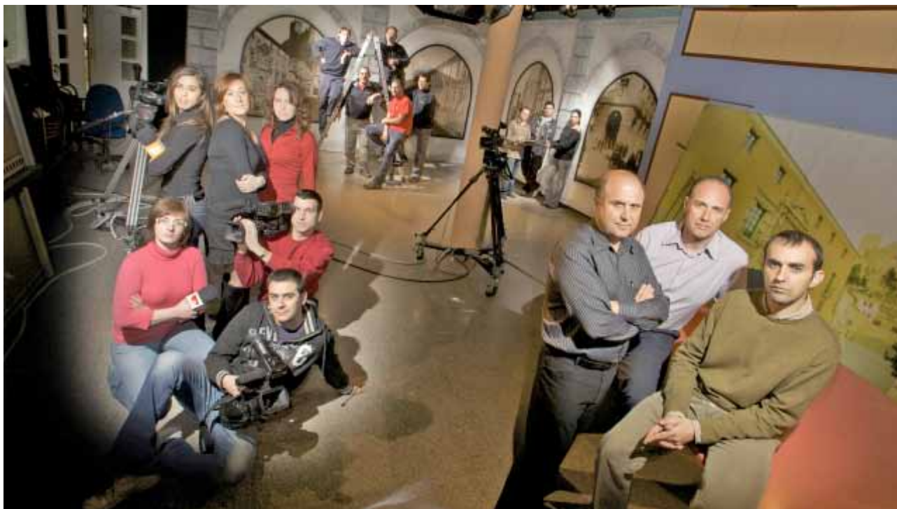
Fig. 29: El equipo de TV Almansa en 2008 en una de las fotografías de la exposición "Los años vividos".