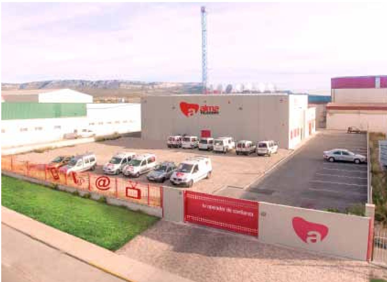
Fig. 31: Edificio del Centro de Datos de Alma Telecom en el polígono industrial en 2012.