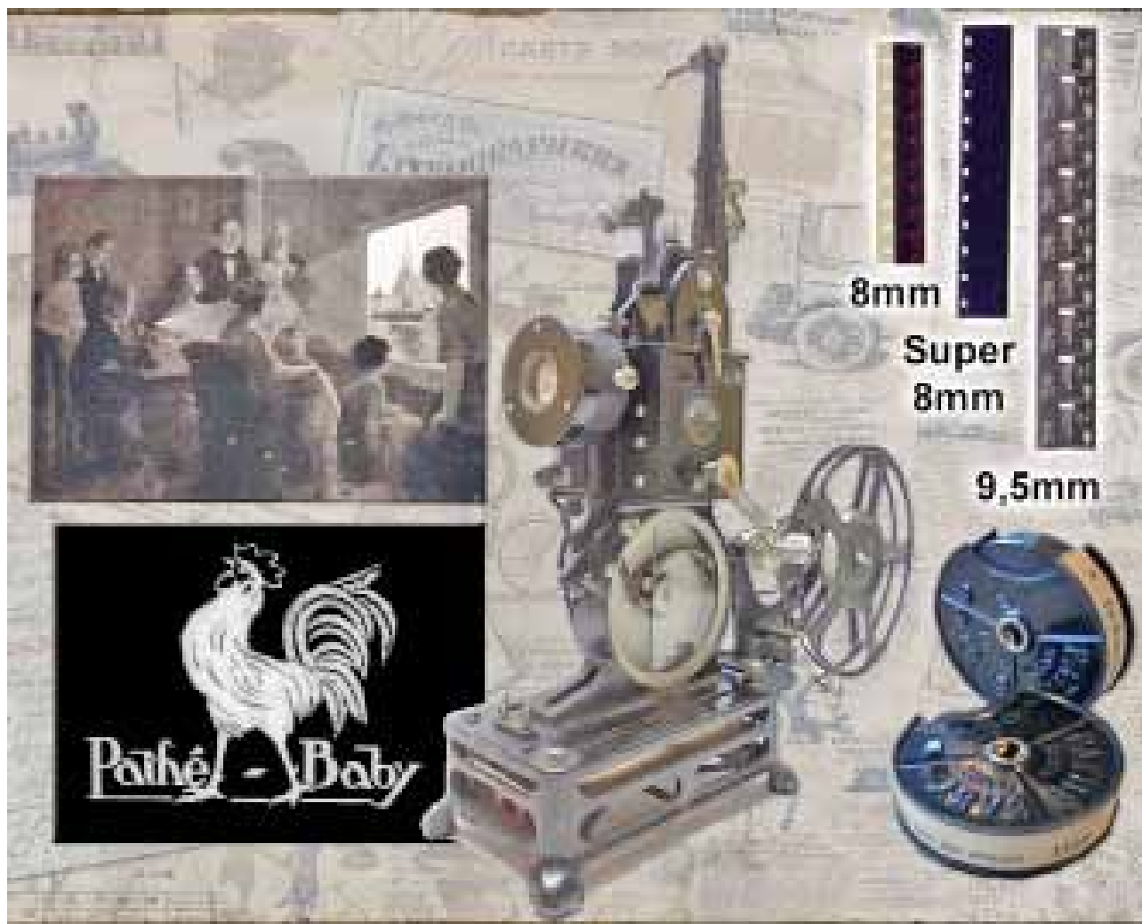
Fig. 1: Proyector de la marca francesa Pathé, y distintos tipos de negativos y celuloide.