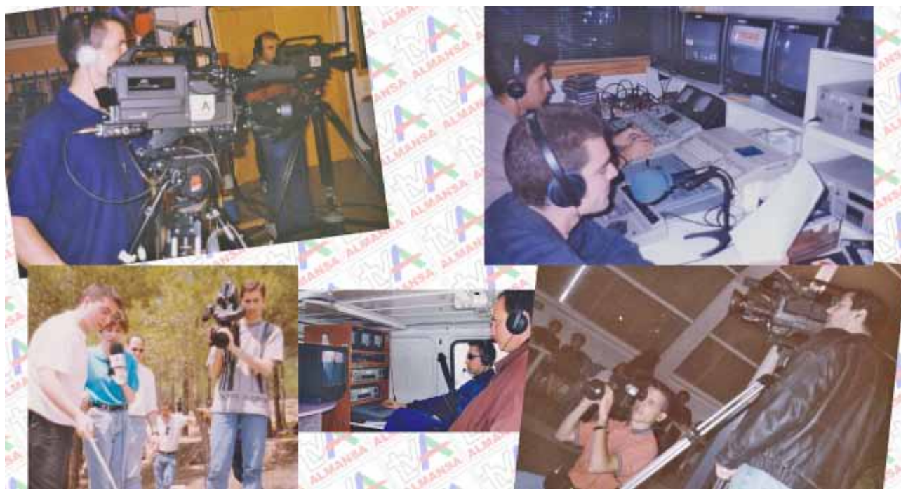
Fig. 13: Varias imágenes del plató, la realización, los cámaras y la unidad móvil de TV Almansa en entre 1996 y 1999.

Para componer la parrilla, existían varias posibilidades como comprar contenidos, películas, series o documentales, permitiendo así completar la programación de la cadena. Pero las opciones disponibles eran películas o dibujos muy antiguos o de poca calidad, por lo que se decidió descartarlo, además de que