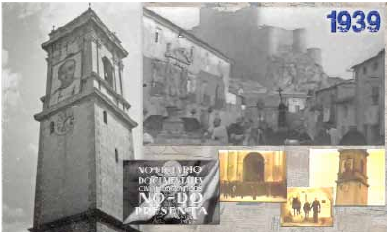
Fig. 3: Fotogramas del NODO a su paso por Almansa el 22 de Noviembre de 1939, con motivo del paso del féretro de José Antonio Primo de Rivera.