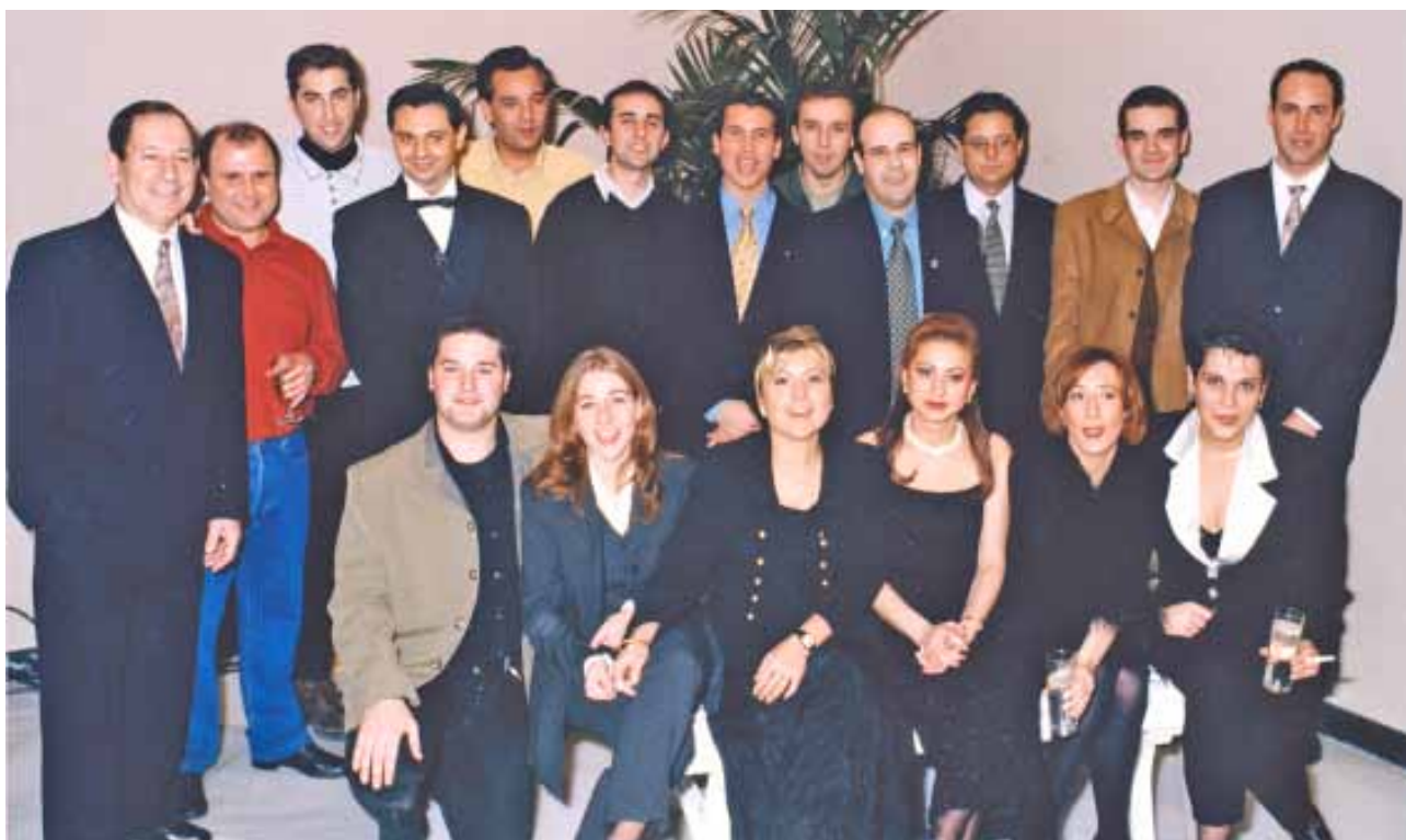
Fig. 14: El equipo inicial de la televisión local durante el 2º Aniversario de TV Almansa en diciembre de 1997.

ya se cubría esa demanda con los canales temáticos ofrecidos por el cable, que tenían también películas y documentales. De este modo, se pensó dirigir la atención hacia la producción propia, que tuviese como principal transfondo Almansa y en la que solo apareciesen sus vecinos y los acontecimientos que aquí sucedían, convirtiendo así a los almanseños en los verdaderos protagonistas de la cadena. Sin embargo, se planteó si la propia televisión local podría tener programación todos los días del año y si la ciudad era capaz de generar contenidos suficientes y variados para realizar una programación regular. En esos primeros momentos, se constató que era viable, ya que más allá de cubrir las fiestas y momentos puntuales, la gran cantidad de asociaciones existentes en la ciudad en distintos ámbitos como el festero, cultural, socio-sanitario o deportivo y la actividad que generaban esas más de cien asociaciones, permitían asegurar la continuidad de contenidos en el canal local.