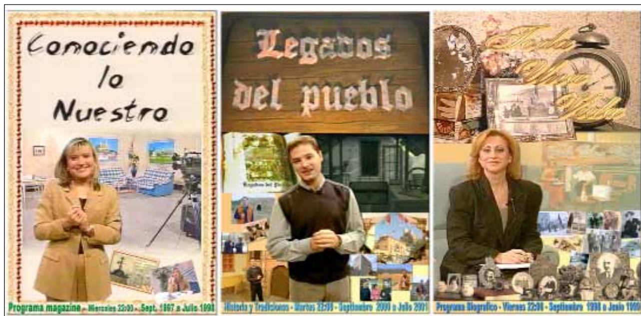
Fig. 27: Otros programas de la cadena, centrados en el patrimonio local como “Conociendo lo Nuestro” o “Legados del Pueblo”, y el dedicado a los almanseños “Toda una Vida”.