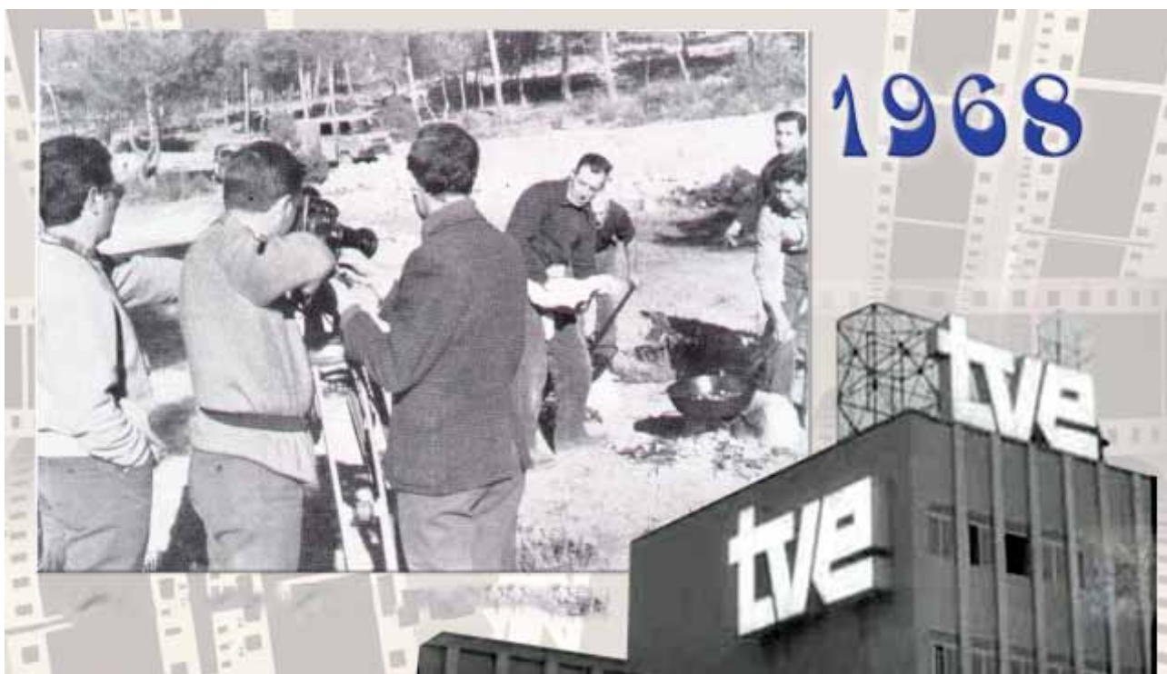
Fig. 5: Grabación del programa de TVE “Aquí España” en Almansa en el año 1968.

La siguiente noticia de filmaciones en Almansa procede del año 1968, cuando Televisión Española seleccionó a Almansa entre otras poblaciones para una serie documental titulada “Aquí España”. (Fig. 5) La serie constaba de 52 capítulos, uno por cada provincia, y se emitió los lunes a las 22:00 h en la segunda cadena de TVE que, a través de la tecnología UHF, funcionaba desde noviembre de 1966. Las cámaras de Televisión española se desplazaron hasta Almansa y en una de sus casas de campo se rodaron diversas escenas de usos y costumbres, así como de la gastronomía local con la elaboración de unos gazpachos manchegos. El apunte de la visita se publicó en la Revista de Fiestas de 1968.