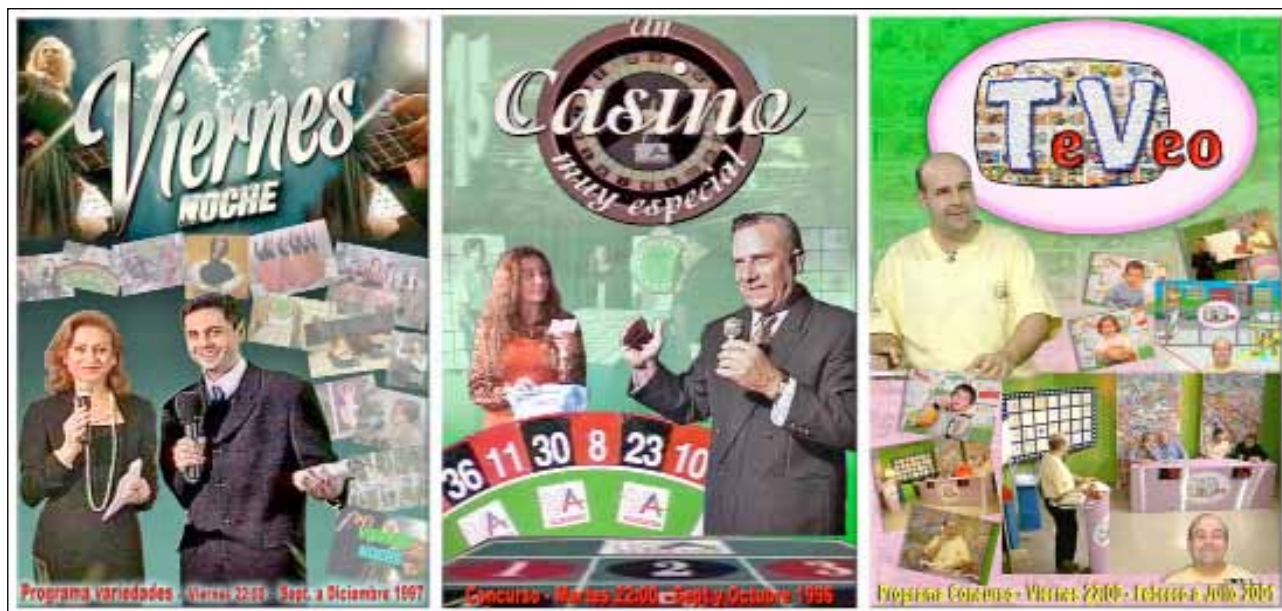
Fig. 22: Programas espectáculo como “Viernes Noche” y concursos como “Un Casino muy especial” o “TeVeo”.

en esta ocasión concursos. Por un lado, “Olimpiadas Culturales”, un concurso de preguntas y respuestas para los más pequeños en el que participaron casi cien niños de la localidad. Y por otro lado, “Un Casino muy especial”, en el que los compradores de los comercios almanseños podían participar y llevarse dinero en metálico o premios, siguiendo el mecanismo de un casino, apostar a unos números y que al lanzar la ruleta en plató, la suerte le permitiese multiplicar lo apostado.