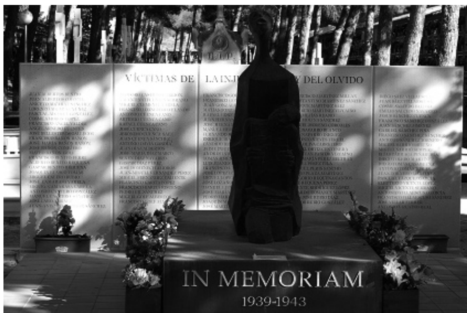
Conjunto escultórico ubicado en el Cementerio municipal de Almansa, inaugurado el 14 de mayo de 2005 en memoria de los republicanos ejecutados tras la Guerra Civil por la dictadura franquista.

Terminó su intervención presentando su idea de Espacio para la escultura como algo alejado del formalismo de los museos y próximo a la idea del “encuentro accidental y táctil” con la obra artística. Además informó de su importante donación artística a la ciudad y de la posibilidad de incorporar otras obras de artistas consagrados ligados a él por estrechos lazos de