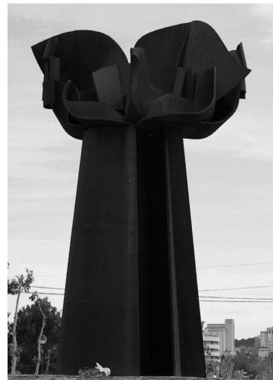
La “Paz aupada” (2001).

Paradójicamente, la presencia de sus esculturas en Almansa, su ciudad natal, se limitó, hasta fechas recientes, al Cristo crucificado de inspiración románica expuesto en la iglesia de San Roque. En 1993 se inauguró la Fuente del Polígono industrial y, en 1999, su monumental Paz aupada , erigida por encargo del Ayuntamiento de Almansa para conmemorar el tercer centenario de la Batalla de Almansa. Se compone como un signo de paz que se eleva por el impulso de dos enormes brazos en medio de la rotonda del 3 de abril, a la entrada de la ciudad.