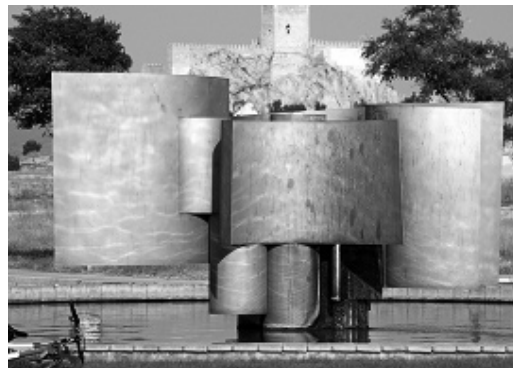
Fuente de una de las rotondas del polígono industrial inaugurada en 1993.

José Luis Sánchez definía así su obra aludiendo a la eterna búsqueda de la perfección por el artista: “Las formas suelen ser reiterativas, como si de una escultura a otra no hubiese más que dar un paso para hacerla teóricamente más perfecta. Unos volúmenes emanan de otros, lo que puede ocasionar cierta monotonía. Posiblemente lo que ocurre es que se trata siempre de la misma escultura, de una continuada variación de la misma idea, de la imposible persecución de una perfección definitiva” 11 . El escritor José Manuel Caballero Bonald ha subrayado “su conducta artística de asombrosa coherencia y fecundidad, a la vez que valoraba la lucidez evolutiva como creador y el temple unitario de su lenguaje”.