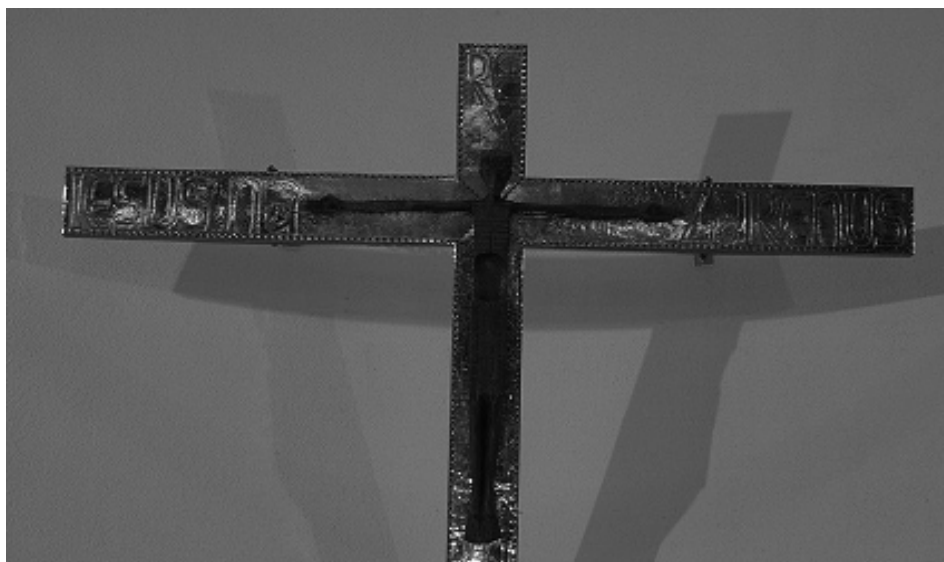
Cristo crucificado de la iglesia de San Roque.

contacto con importantes arquitectos, con los que descubro la importancia de la integración de las artes, la esencia de la Bauhaus. Con otra beca puedo ir a París completando mi formación clásico-mediterránea con las corrientes conceptuales que entonces empiezan a abrirse camino. Trabajo en el taller de cerámica de Pierre Canivet; conozco a la hija de mi maestro, con la que me casaría al poco tiempo” 9 .