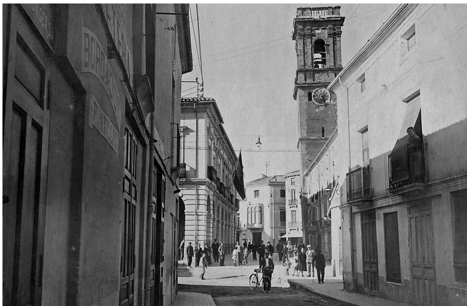
La calle de San Francisco pasó a llamarse de Fermín Galán, recordando al militar fusilado por la monarquía en Jaca, tras el intento fallido de sublevación militar a favor de la República. A la izquierda de la fotografía, en el balcón del Ayuntamiento, ondea la bandera tricolor republicana.

de carácter republicano o socialista (República, Fermín Galán, Ángel García Hernández, Joaquín Costa, Primero de Mayo...); la no participación de las autoridades municipales en actos de carácter religioso para mostrar la neutralidad del consistorio, así como la suspensión del toque de la campana de la torre del reloj municipal con motivo de dichos actos religiosos 19 . Estas últimas medidas, muestra del laicismo del consistorio almanseño, provocaron por parte de algunos grupos anticlericales incidentes contra el convento de franciscanos y durante una procesión, que requirieron de la intervención de las autoridades civiles. Sucesos similares se produjeron en Albacete capital y Hellín.