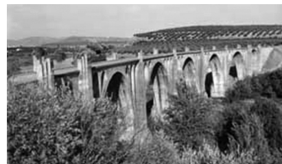
Para mitigar el excesivo paro, se retomaron las obras de la vía férrea Baeza-Utiel, por la que nunca llegaría a circular ningún tren. En la foto, el todavía inacabado viaducto de Los Barros, sobre el río Guadalimar.

Para paliar las carencias estructurales que había a la vez que para enjugar el abundante paro obrero se creó un Plan Nacional de Obras Públicas, contando para ello con la financiación de distintas instituciones del Estado, además de la colaboración de las administraciones locales y de otros recursos provenientes de particulares. Aportaciones que claramente resultaban insuficientes. Dentro de las grandes obras se retomaron las obras del ferrocarril Baeza-Utiel, pese a la escasa rentabilidad que se le veía a esta línea férrea.