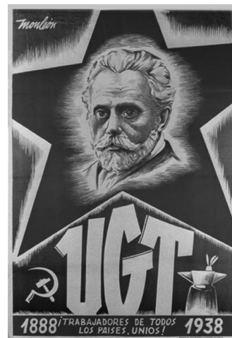
La UGT era el sindicato obrero más arraigado en Almansa.

El sistema de libertades de la República favoreció la proliferación de este tipo de asociaciones sindicales para encauzar las reivindicaciones de los obreros, además del esfuerzo que hicieron los socialistas a partir de la segunda mitad del año 1931 para que proliferara el asociacionismo obrero. Los sectores obreros más importantes fueron el agrario y el ferroviario.