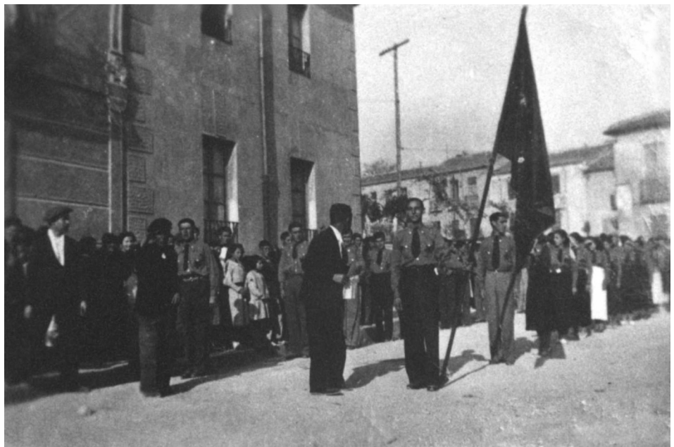
Manifestación del Primero de Mayo de 1936 en Almansa.

Dentro de la legalidad el Gobierno realizó algunas concesiones a la izquierda, otorgando la amnistía política y social, designando nuevos ayuntamientos y diputaciones con mayoría de izquierdas e impulsando mejoras para las clases obreras, aunque los sectores más radicales de la izquierda las consideraron insuficientes, presionando con algunas actuaciones ilegales como la