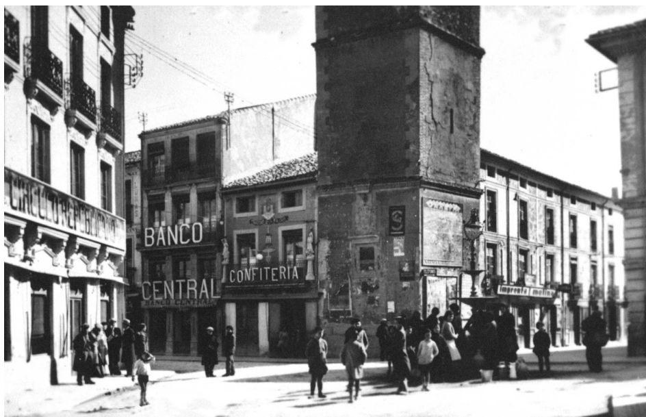
A la izquierda, Círculo Republicano, situado en la Plaza de la Constitución, frente al edificio del Ayuntamiento y a la Torre del Reloj.

En mayo de 1931 muchos círculos republicanos se incorporaron a Acción Republicana (AR), partido que atrajo a verdaderos republicanos y también a oportunistas ambiciosos. Albacete fue una de las provincias donde mayor fuerza tuvo Acción Republicana. En 1933 contaba con 12.000 afiliados y 81 comités locales. La agrupación de Almansa se fundó en 1931, siendo algunos de sus miembros masones.