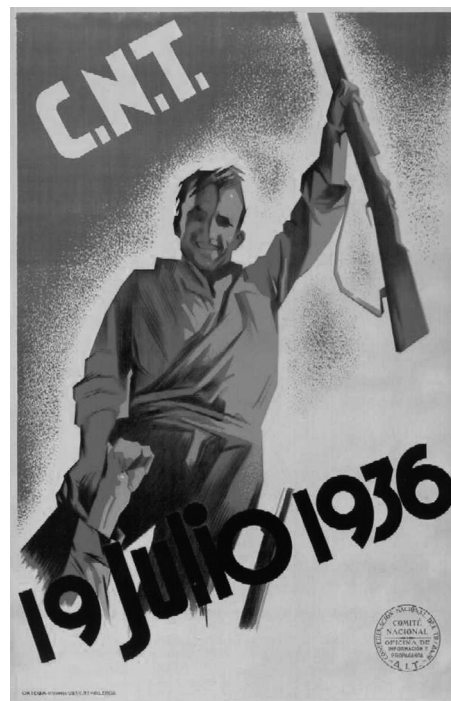
No se tienen noticias de la presencia en Almansa de las organizaciones anarquistas, CNT y FAI, antes de declararse la guerra.

Además de las organizaciones sindicales citadas encontramos otras sociedades relacionadas con las necesidades de los obreros, como las de Socorro Mutuo, y asociaciones de carácter cultural y recreativo. Asimismo, la masonería estuvo estrechamente relacionada con Almansa, ya que desde finales del siglo XIX existieron varias logias en la localidad, jugando un papel