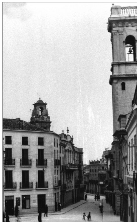
Calle Virgen de Belén, en la acera izquierda se hallaba el Teatro Cervantes, edificio modernista en el que también estaba la sede de Acción Popular.

Durante este periodo se va a dar una confrontación política, pero no sólo entre los partidos en el gobierno y las fuerzas de izquierdas, con continuos ataques, sino también dentro del propio Gobierno, entre los radicales y los cedistas, ya que aunque ambas fuerzas deseaban rectificar las reformas del primer bienio, también pugnaban por alcanzar mayores cotas de poder, lo que ocasionaría un crecimiento de la CEDA en detrimento del PRR, enfrentamientos que se agudizarán a partir de los sucesos de octubre de 1934. Por tanto, vamos a asistir durante este periodo a un ascenso de la derecha no republicana, un estancamiento del republicanismo moderado y un retroceso de la izquierda obrera, que iniciará su