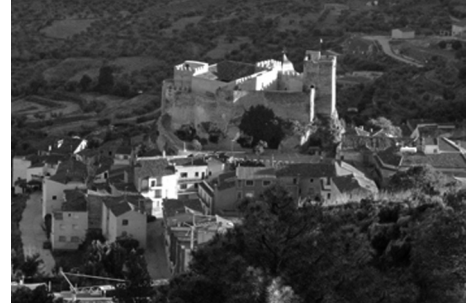
Los sucesos de Yeste de mayo de 1936, se saldaron con dieciocho muertos, diecisiete campesinos y un guardia civil.

Circunstancias que hicieron que se produjeran situaciones de tensión promovidas por la necesidad del campesinado y en ocasiones cobijadas por muchos ayuntamientos de izquierdas, lo que provocó que el gobernador civil advirtiera a los alcaldes de las responsabilidades en que podían incurrir. Los jornaleros realizaron acciones ilegales como medio para subsistir y como medida de presión, lo que ocasionó situaciones de tensión y violencia como la acaecida en Bonete, a mediados del mes de marzo y en la que resultó muerto un guardia civil, y sobre todo en Yeste, en los últimos días de mayo, cuando jornaleros ocuparon y roturaron tierras de la familia Alfaro, lo que provocó el enfrentamiento con la Guardia Civil y que se saldó con 18 muertos, 17 campesinos y 1 guardia civil.