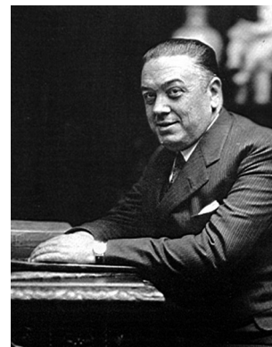
Diego Martínez Barrio abandonó en 1934 el Partido Republicano Radical para fundar un nuevo partido: Unión Republicana.

Fuente: República (28-04-1935) y Censo Electoral (1935). Elaboración propia.