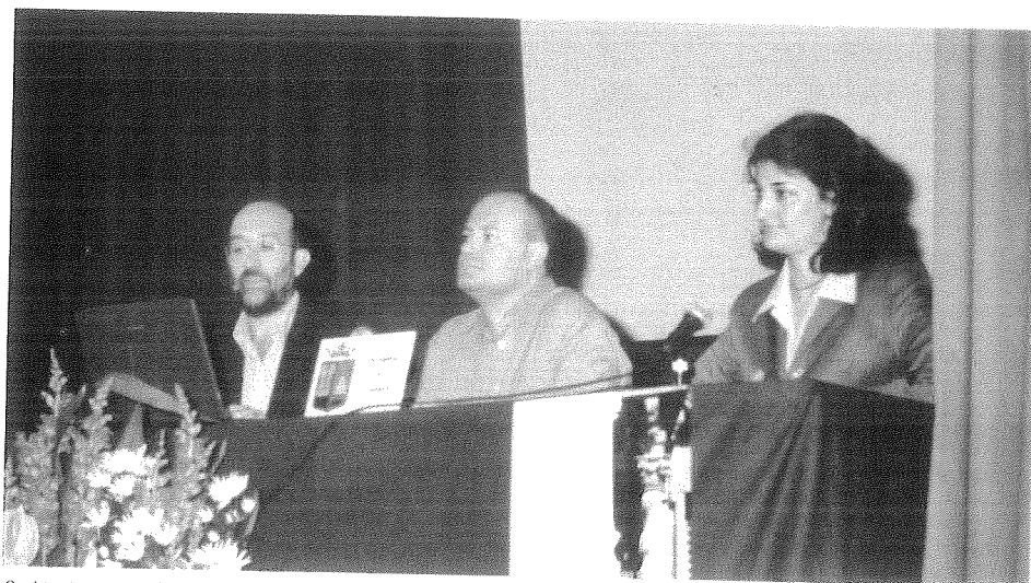
Sesión inaugural de las IX Jornadas de Estudios Locales con la presencia (de izquierda a derecha) del Presidente de Torre Grande, el Primer Teniente de Alcalde y la Concejala de Cultura del Ayuntamiento de Almansa.

Cuando en mayo de 2006 tengan lugar las Jornadas de Estudios Locales, referidas en esta ocasión al tema de la ecología y el medio ambiente, éstas habrán llegado a su XIII edición. Hasta ese momento, han sido diversos los temas tratados en las sucesivas ediciones: desde la arqueología (con excelentes